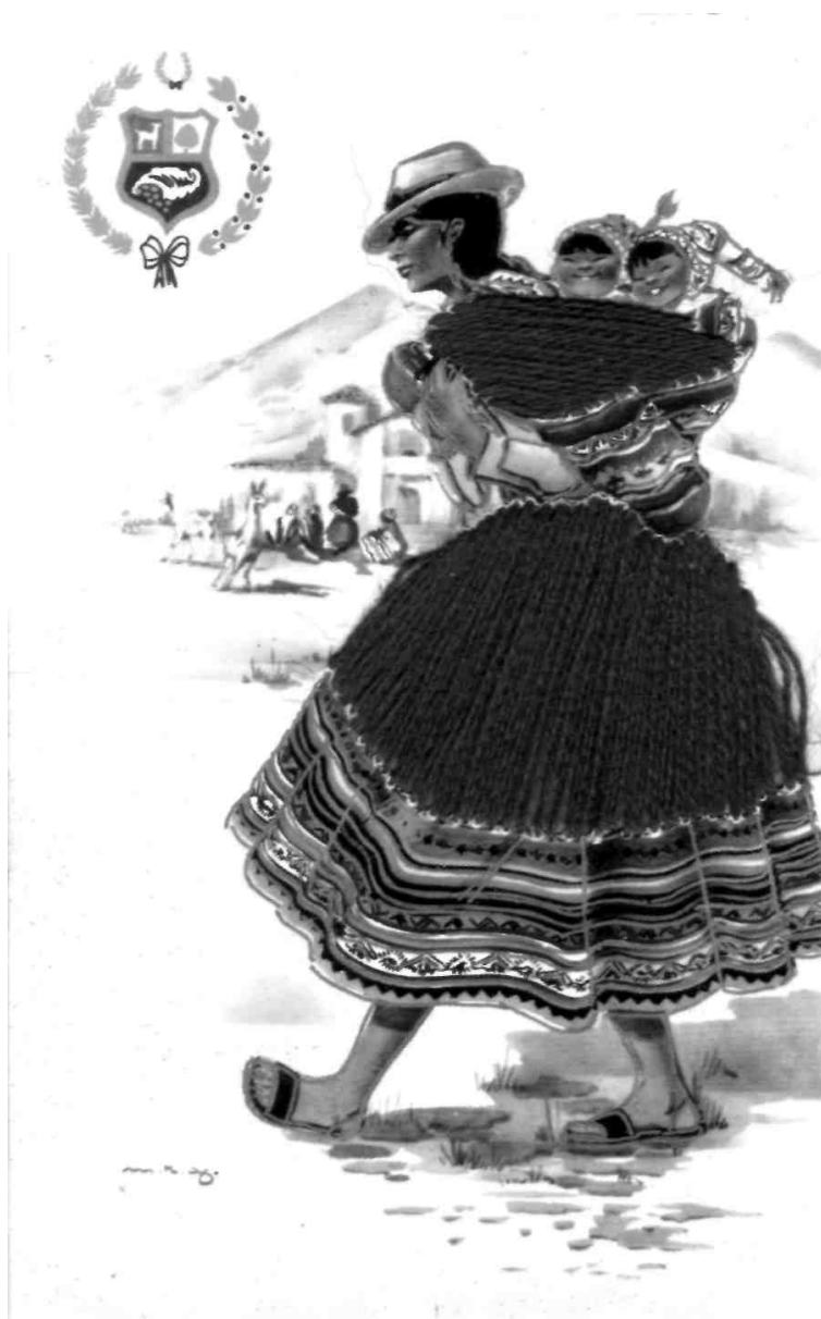
Индианка с детьми (департамент Уануко)