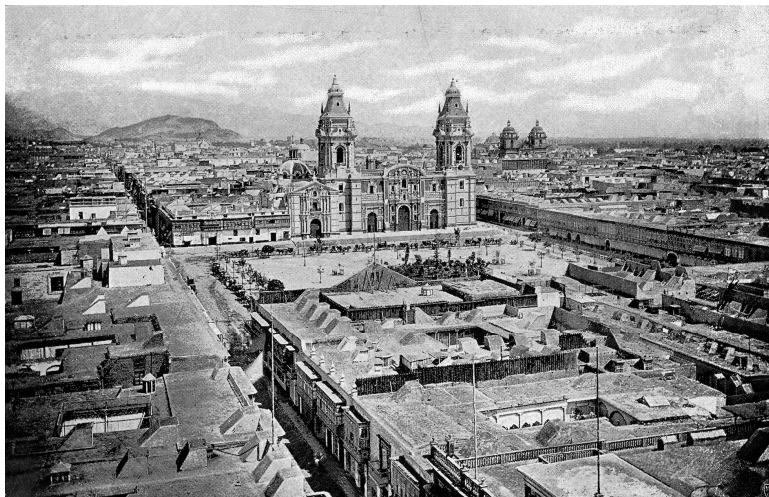
Пласа Майор (Центр) Лимы в конце XIX века.

Неустойчивое экономическое положение рабочих и ремесленников было постоянным источником крупных выступлений трудящихся в 1887-1894 гг. с требованиями повышения зарплаты в Лиме, Кальяо, Трухильо, Серро-де-Паско и др. городах.