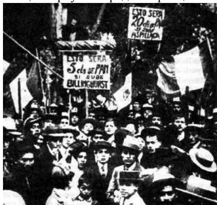
Демонстрация сторонников Биллингхурста в мае 1912 г.

В различных городах провинций прошли демонстрации в под-