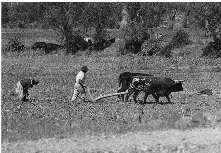
Крестьяне сьерры на пахоте

На косте площадью в 177 тыс. км жило 900 тыс. человек. Более 50% территории занимала сельва, или монтанья, где жило примерно 450 тыс. человек, в основном индейских племен 20 . "Бедность, невежество, рабство" - так характеризует жизнь индейцев-крестьян сьерры в начале XX в. известный перуанский историк-экономист К. Угарте 21 .